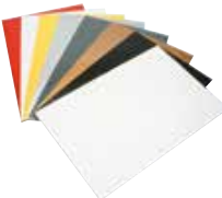
808 250 / 808 259 KLM-PLY2 SERİSİ